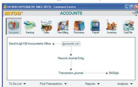
Gambar 3. Tampilan awal dari Transaksi